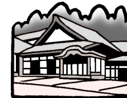
高野山・金剛峯寺 (和歌山県)