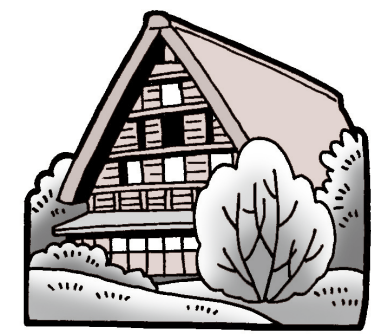
五箇山の合掌造り集落 (富山県)